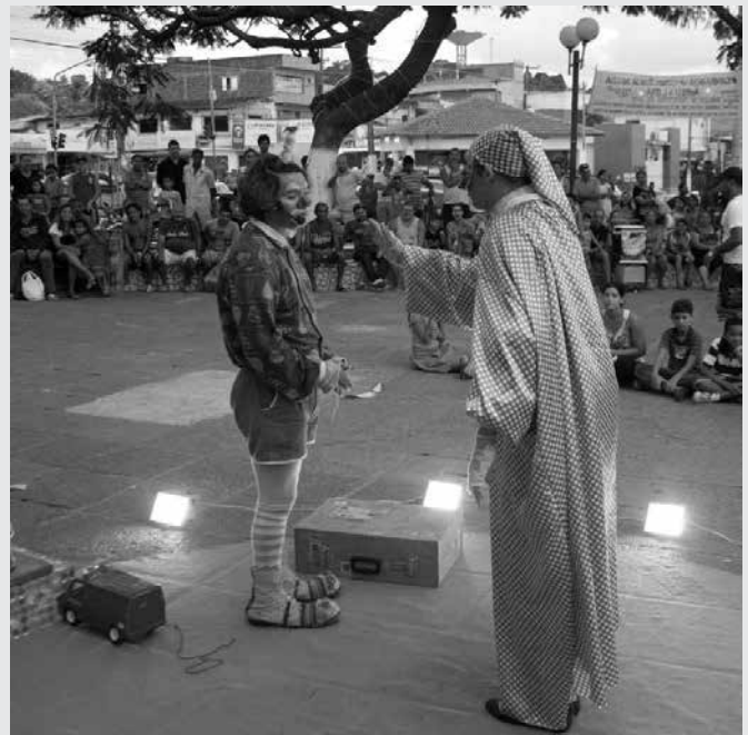
Cia 2 em Cena de Teatro, Circo e Dança

Cia. 2 em cena de Teatro, Circo e Dança | Recife | PE cia2emcena@gmail.com